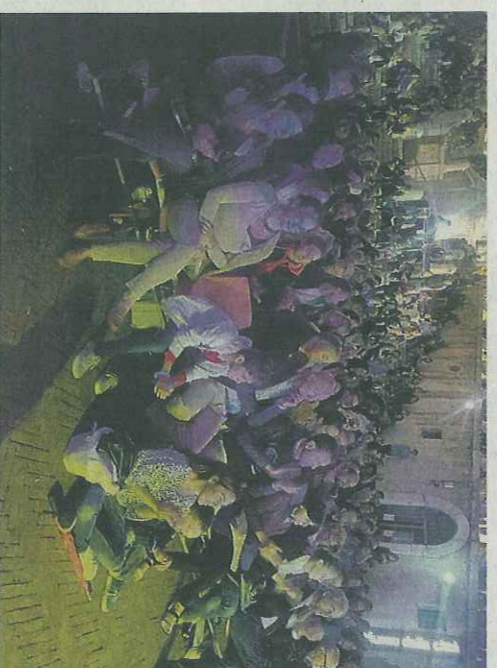
Il concerto sotto le stelle di Paola Turci ha attirato tanta gente nella suggestiva cornice di piazza del Papa.

Coi calare della sera, poi, le luci si sono accese su piazza del Papa. Grande protagonista del dopocena è stata la cantante Paola Turci che, introdotta dal Magnifico rettore Sauro Longhi, ha alternato i suoi successi musicali a dialoghi sul ruolo della ricerca nell'arte. Alle 23, invece, gli occhi erano tutti puntati verso la Chiesa di San Domenico, sulla cui facciata un video-mapping rendere omaggio alla città. La Notte europea dei ricercatori, per la gioia dei residenti, si è conclusa con la Silent Disco Unipvm a cura di Radio Arancia Network e Bicchio Dj.